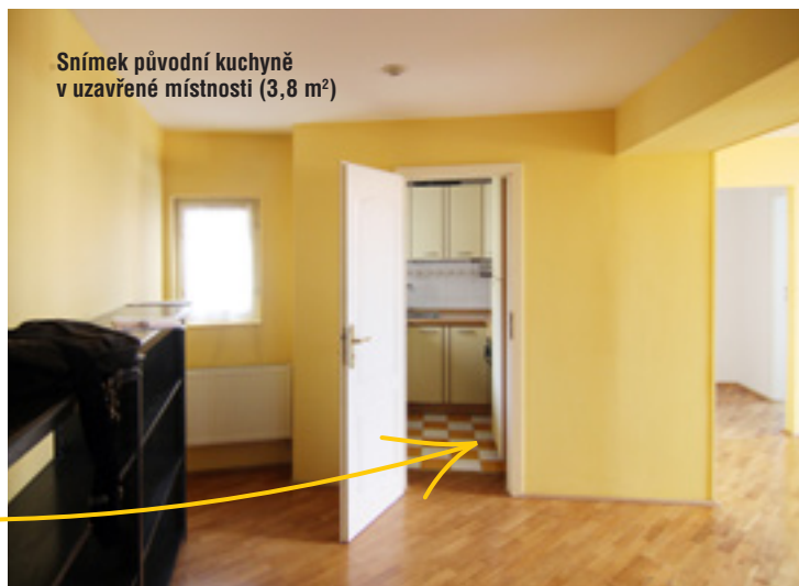
Snímek původní kuchyně v uzavřené místnosti (3,8 m 2 )